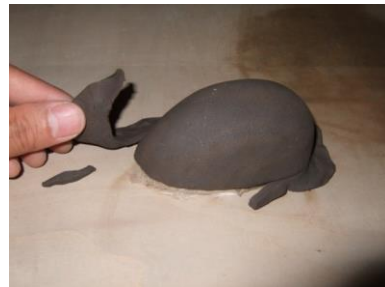
⑥ 余分を針でカットします。