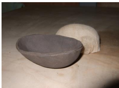
⑦ 型からはずします。