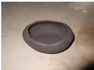
⑧ ふちをすぼめます。