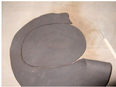
③ タタラを型を覆う程度の大きさにカットします。