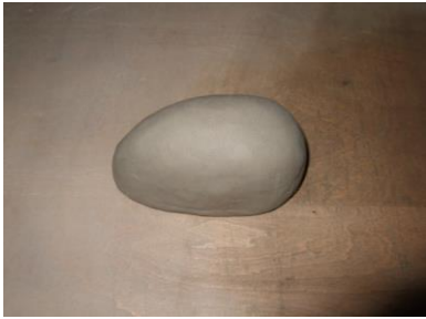
① 粘土で型をつくります。たまご型です。