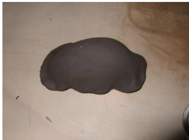
⑤ タタラを押さえて型に合わせます。