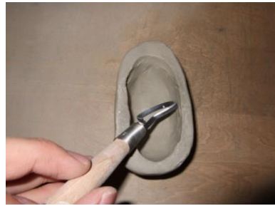
② 中をカギベラで掘って、素焼きをすれば何度でも使えます。