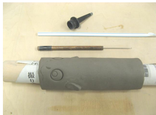
④身近にあるストローで押ししたり、針でひっかいたりして目、鼻、ひげを描き、ひれもつけます。その後、新聞紙ごと抜きます。