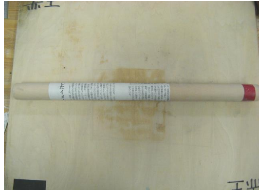
②のべ棒に新聞紙を巻きつけテープ止めします。