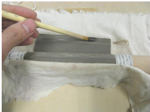
③粘土をのべ棒に巻きつけ、重なりはドベをつけて接着します。このとき、布と一緒に粘土を巻きつけると、粘土にひびが入りません。