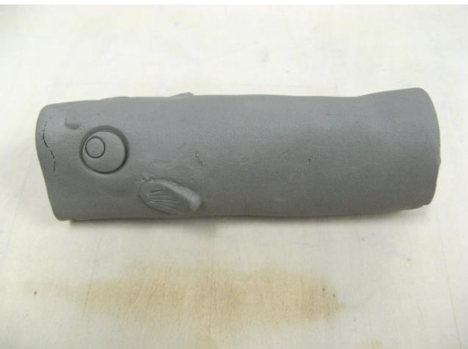
⑤新聞紙を取り外し、形を整えて完成です。お好みでうろこを描き入れたり、海波の転写紙を貼り付けてもステキです。