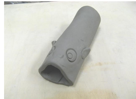
<完成図> コイに見えるでしょうか？うろこをつければ絶対コイに見えるはず！ぜひ、見本以上のコイを作ってみてください。